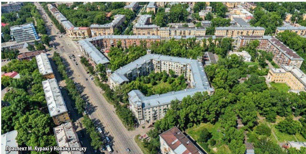
Праспект М. Куракі ў Новакузнецку