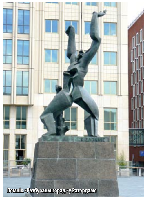
Помнік «Разбураны горад» у Ратэрдаме