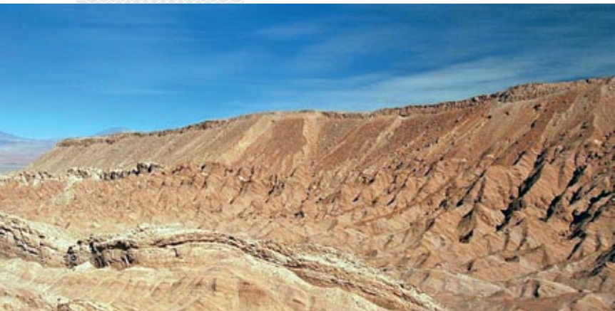
▼ Кардыльера Дамейка