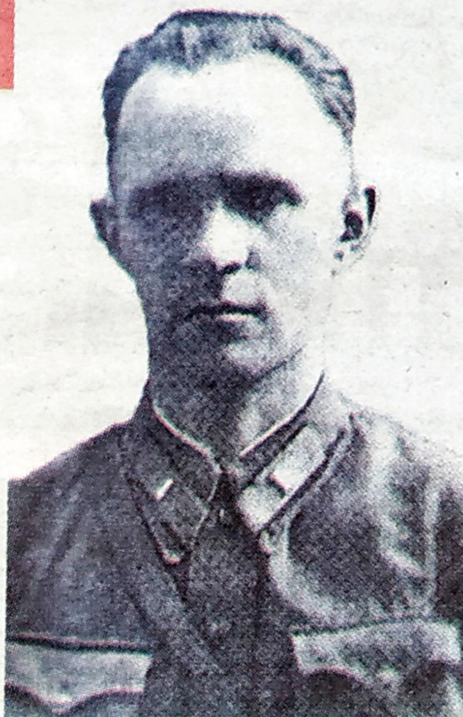
К. Г. ВЛАДИМИРОВ.

За мужество и героизм, проявленные при защите Могилева, капитан Константин Григорьевич Владимиров был награжден орденом Ленина посмертно — и зачислен почетным солдатом