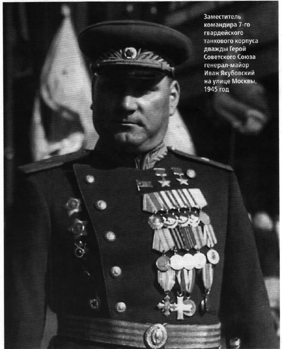
Заместитель командира 7-го гвардейского танкового корпуса дважды Герой Советского Союза генерал-майор Иван Якубовский на улице Москвы, 1945 год

Генерал-фельдмаршал Манштейн познал советских танкистов и под Сталинградом, и на Курской дуге. Теперь он нацелился на Киев. Манштейн рассуждал так: советский Верховный не посылает танковую гвардию на второстепенные участки. Удар по Киеву будет отсюда, только отсюда! Манштейн перебрасывает к Велико-