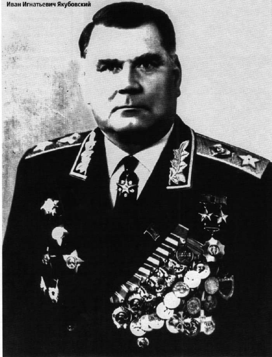
Маршал Советского Союза Иван Игнатьевич Якубовский