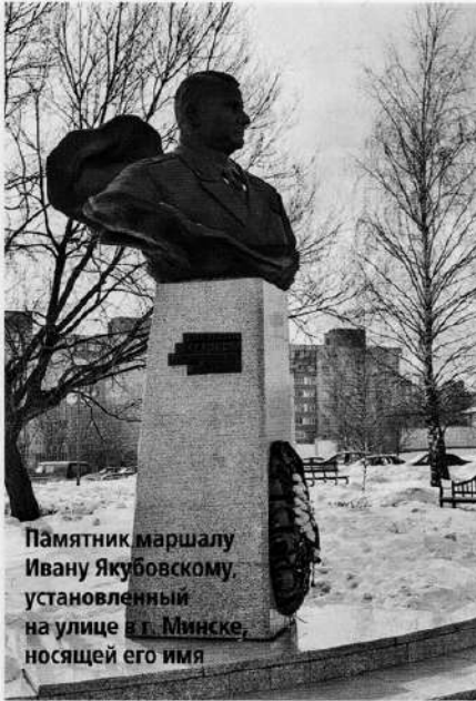
Памятник маршалу Ивану Якубовскому, установленный на улице в г. Минске, носящей его имя

мия, преодолев узкий «колтувский коридор», устремилась на Львов.