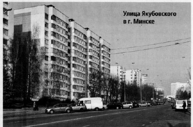
Улица Якубовского в г. Минске

После окончания Великой Отечественной войны Иван Игнатьевич занимает ряд высоких должностей в Вооруженных Силах. Он окончил Военную академию Генерального штаба. С апреля 1967 г. Маршал Советского Союза И. И. Якубовский был назна-