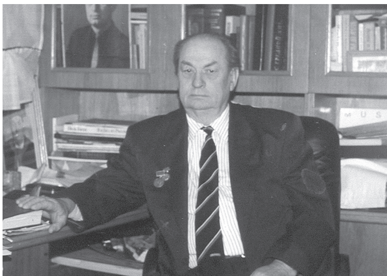
И. Н. Гришин (1933—2015)

27 января 1976 г. профессор И. Н. Гришин впервые в мире выполнил трансплевральную шунтирующую пластику пищевода тощей кишкой с прямой реваскуляризацией трансплантата из нисходящего отдела грудной аорты. Кроме лапаротомии, были выполнены торакотомия слева в шестом межреберье и рассечение левого купола диафрагмы. На шее на первом этапе сформирован эзофагоэнтероанастомоз «конец в бок». Вторым этапом 11 марта 1976 г. выполнена повторная лапаротомия, сформирован еюногастроанастомоз «конец в бок» [10].