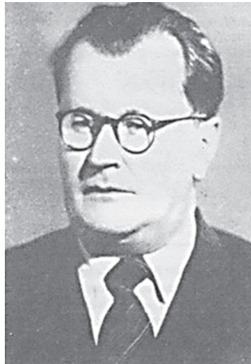
И. М. Стельмашонок (1902—1976)

Будучи хирургом большого диапазона, И. М. Стельмашонок активно развивал в том числе и травматологию. Имея уникальный для СССР опыт в эзофагоэнопластике, что неоднократно публично признавал великий советский хирург академик С. С. Юдин, Иван Моисеевич подготовил и в 1951 г. защитил докторскую диссертацию по травматологии. Он одним из первых в СССР предложил передовую для того времени активную и раннюю хирургическую тактику — металлоостеосинтез переломов трубчатых костей, но ВАК СССР диссертацию «Оперативное лечение закрытых и открытых переломов» не утвердил. Однако И. М. Стельмашонок не утратил силы духа. В 1952 г. он опубликовал монографию по травматологии с аналогичным названием. Он начал активно готовить учеников: с 1959 под его руководством защищены 8 кандидатских диссертаций по проблемам ожогов пищевода и желудка, 3 — по травматологии, 8 — по другим разделам хирургии.