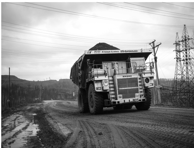
«По дороге в Казас...», 02.11.13 г.

цы и 18 – представители других этнических групп. Дорога в Казас из г. Мыски проходит через промышленные пути, по которым каждый день перевозят уголь многотонные «БЕЛАЗы». Само присутствие на такой дороге – а это единственный путь, связывающий деревню и город – создает ощущение опасности. По приезде на место исследования мы попали в почти пустую деревню. Однако нам удалось застать некоторых жителей, побеседовать с ними, записать несколько интервью, в ходе которых мы попытались разобраться в сути конфликта.