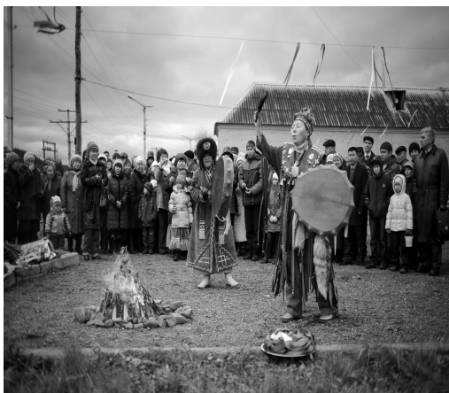
Обряд освящения духовного центра «Эне Таг» шаманками. 03.11.13 г.

оформляли документы на продажу. Также удалось сделать фотографии угольных карьеров, которые все больше приближаются к деревне. Завершило поездку мероприятие в деревне Чувашка, которая находится на другом берегу р. Мрас-су. Оно было связано с открытием шорского духовного центра «Эне Таг», что, по замыслу организаторов этого центра, представителей общественных организаций, должно скрепить шорцев и дать толчок развитию шорской культуры.