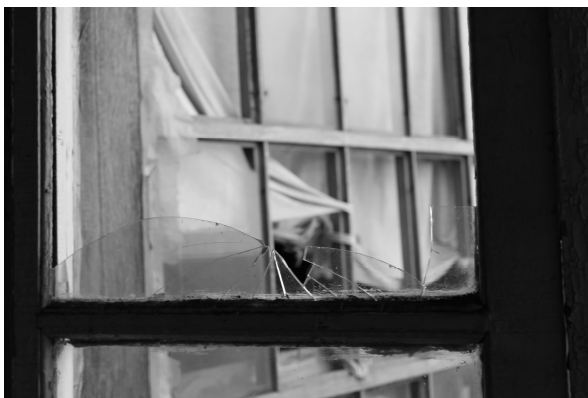
Выбитое стекло одного из домов в Казасе, 01.11.13 г.

Бесконечные взрывы, связанные с добычей угля, производятся на расстоянии всего лишь нескольких километров от Казаса. Они вызывают пыль, которая, безусловно, влияет на здоровье людей, она – и это видно – осаждается на растениях и в воде. Взрывы сопровождаются также подземными толчками, которые разрушают дома. Выбитые стекла, трещины в основании домов или в дымоходах, перекосившиеся хозяйственные постройки являются в Казасе привычной картиной.